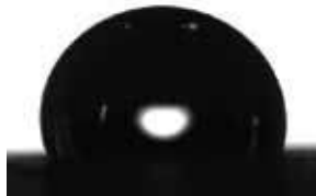
Επιφάνεια Χαρτονιού με SurfaPore F

Ανάλυση Γωνίας Επαφής αποδεικνύει ότι μια σταγόνα νερού σε ένα μη τροποποιημένο δείγμα (αριστερά) απορροφάται από το φυσικό υπόστρωμα, ενώ το υπόστρωμα χαρτονιού με SurfaPore F (δεξιά) παραμένει αναλλοίωτο.